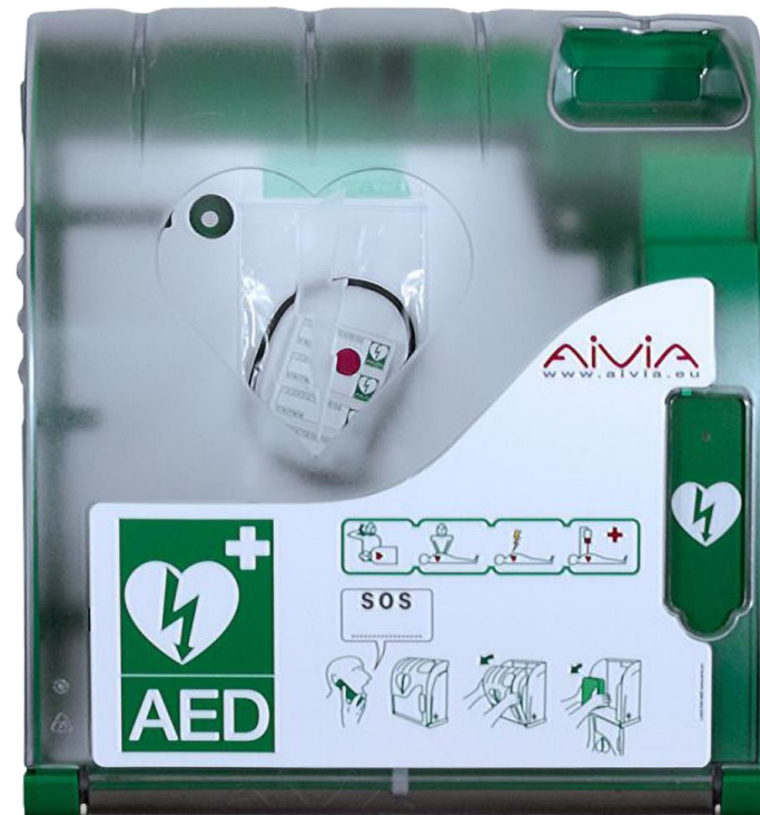
ZONDER cijfercode-slot Heeft onze voorkeur!!