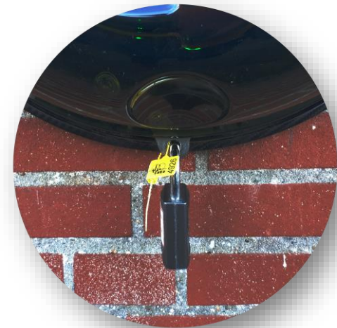
met Hangslot + Breekzegel